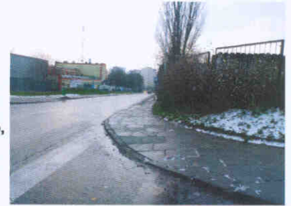
widok z ul. Kresowej widoczność na skrzyżowaniu wlot z ul. Bandurskiego,