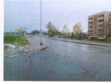
widok z ul. Kresowej widoczność na skrzyżowaniu wlot z ul. Rostocką,